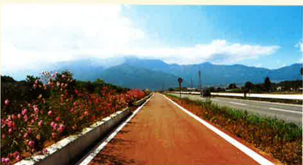
ジョギングコース（赤）