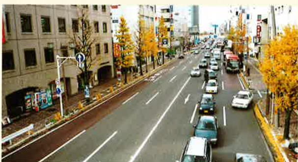
新潟バスレーン（赤）