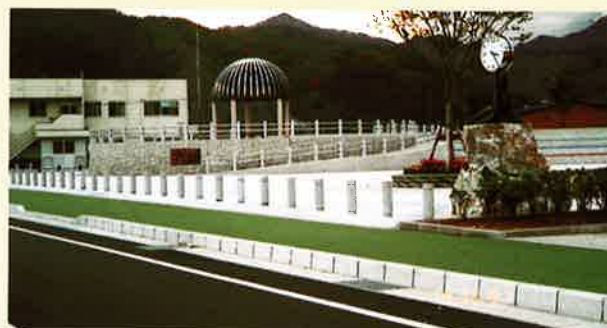
岩手イベント会場（調色緑）