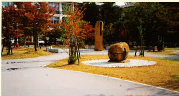
山形大学構内（グレー）

公園や遊歩道など、自然や街並みとの調和を考えた景観計画に、ナチュラルな色調のカラー舗装が、快適とやすらぎをプラスしていきます。