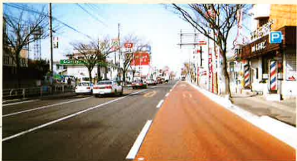
福岡バスレーン（茶）

鮮やかな色相のカラー舗装が分岐点・バスレーンなど車の流れを明確に誘導し、快適な車社会をバックアップします。